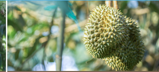
1 tháng trước thu hoạch