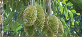
Vô cộm (Bón 2 lần)