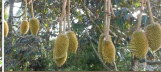
Sau đậu trái (Bón 3 lần)