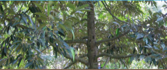
Sau thu hoạch (Bón 3 lần)