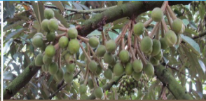
Lúc ra hoa