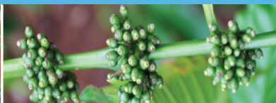
Đầu mùa mưa