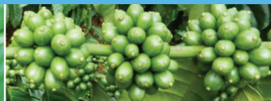
Giữa mùa mưa