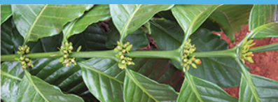
Trong mùa khô