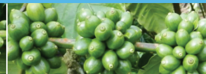
Cuối mùa mưa