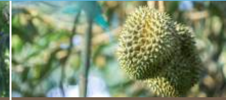
1 tháng trước thu hoạch