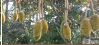
Sau đậu trái (Bón 3 lần)