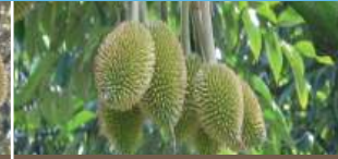
Vô cớm (Bón 2 lần)