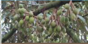
Lúc ra hoa