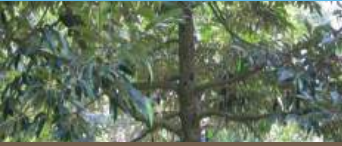
Sau thu hoạch (Bón 3 lần)